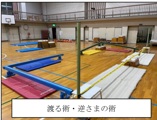
渡る術・逆さまの術