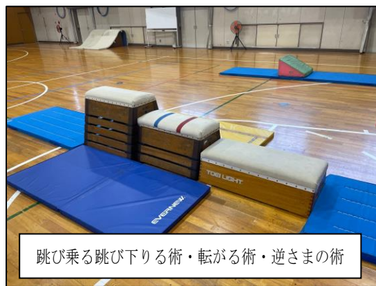
跳び乗る跳び下りる術・転がる術・逆さまの術