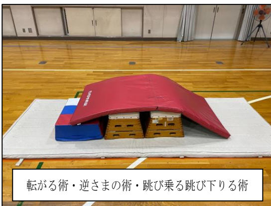
転がる術・逆さまの術・跳び乗る跳び下りる術