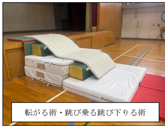
転がる術・跳び乗る跳び下りる術