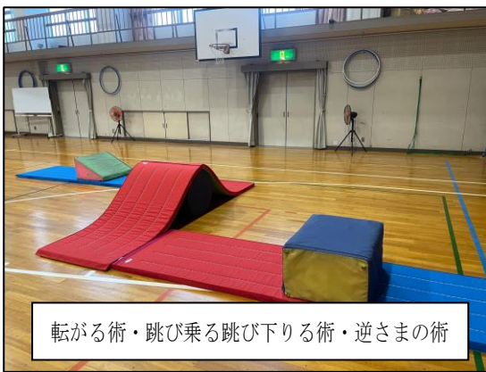
転がる術・跳び乗る跳び下りる術・逆さまの術